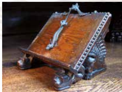
Malý držiak pre knihy v sakristie