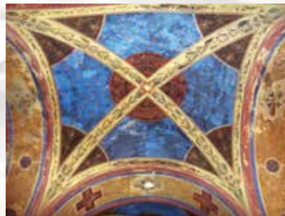
Iba v podkostole sa zachovala originálna maľba na povole

Napriek menším rekonštrukciám sa stav kostola zhorší. Preto je nad hlavnou bránou ochranná strecha, a preto sa nezvoní na poľudnie. Náš kolektív okrem modlitieb upúta pozornosť na hontoy skrývajúce sa v kostole bohatým liturgickým a kultúrnym životom, s nádejom, že Hlavný kostol vo Františkove raz bude stáť v takej podobe, ako ho naši predkovia predstavili.