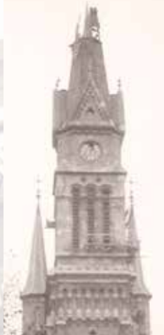
Rozstretená veža, 1956

Na prelome storočí duchovnú službu prevzalo duchovenstvo ostrihomskej arcidiecézy. Počas svetových vojnách kolektív poškodený kostol obnovil z vlastných síl, ale Rákošioho diktatúra potlačil civilnú a karitatívnu aktivitu farnosti: náš kultúrny dom na ulicu Ráday č. 57 poštátnili. Bakáčovske námestie bolo v roku 1956 svedkom bitiek a popráv. Po zmene komunistického režimu sa aj náš kolektív oživil , nádherným dôkazom toho je obnovená budova farnosti: tu už čoskoro 2 storočí môžu nájsť duchovný útulok františkárski katolícki veriaci.