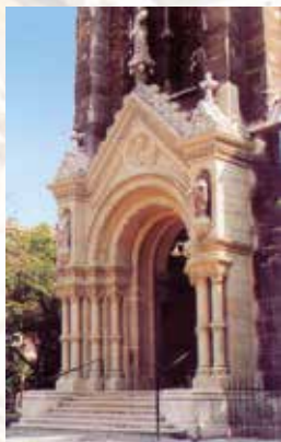
V roku 2002 obnovená hlavná brána

V 1865 kostol zavreli, kvôli poškodeniam, ktoré vznikli počas záplav v 1838. Budovateľská komisia zvolila namiesto neogotickej predstavy Frigyesa Feszla a Imricha Steindla neorománsky plán Mikuláša Ybla . Kostol, ktorý bol postavený z podpory štátu a hlavného mesta, vysvätil 24. apríla 1879 primáš Ján Simor na počesť Františka Assisiho - primášsky erb sa nachádza na hlavnom oltári. Stavanie hlavného oltára podporoval sám primáš. Prácu slávnych umelcov a majstrov obdivovali okrem kráľovského páru (oni v roku 1879 oslavili striebornú svadbu) aj Michal Munkácsy a František Liszt . V nasledujúcom roku podľa plánov Győzőho Cziglera vystavili neorenesančný komplex budov na Bakáčovskom námestí. V nich fungovala od 1884 popri samospráve a škole aj farnosť.