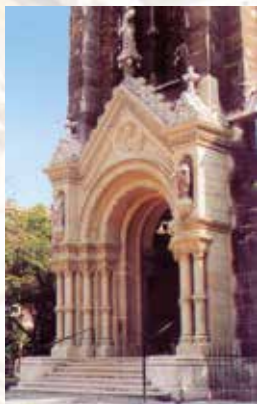
Poarta principală, renovată în 2002

Ca urmare a pagubelor cauzate de marea inundație din 1838, biserica a fost închisă în anul 1865. Pentru noua biserică, a fost selectat planul în stil neoromanic al lui Miklós Ybl , în locul celui neogotic prezentat de Frigyes Feszl și Imre Steindl . Biserica, ridicată din fonduri alocate de stat și de oraș, a fost sfințită în onoarea lui Sf. Francisc de Assisi la data de 24 aprilie 1879 , de către prințul arhiepiscop János Simor, al cărui blazon poate fi văzut pe altarul central. Opera artiștilor și meșterilor iluștri a fost admirată chiar și de către cuplul