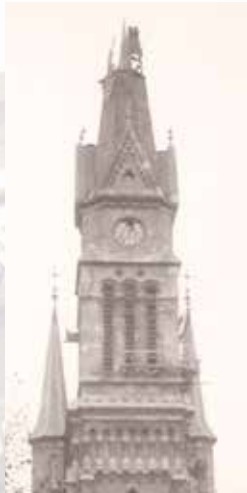
Turnul distrus, 1956

La cumpăna dintre secole, serviciul bisericesc a fost preluat de Arhidieceza din Esztergom. Deși biserica puternic afectată de cele două războaie mondiale a fost reconstruită de către comunitate, dictatura stalinistă a suprimat activitatea civilă și caritativă semnificativă a parohiei. În timpul Revoluției Ungare din 1956, Piața Bakáts a fost scena unor lupte și execuții. Ca urmare a schimbării regimului, viața comunității noastre a fost reînnoită , rezultând în restaurarea splendidei clădiri parohiale, locul unde credincioșii romano-catolici își găsesc casa spirituală de aproape două secole .