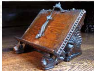
Suport de carte în sacristie

„CAPITALA ORICUM NU AVUSE O BISERICĂ CATOLICĂ CARE ISĂ impresioneze prin proporționalitate, eleganță și uniformitate” – scrie Vilmos Kurtz, primul nostru preot paroh. Biserica construită în stil neoromanic a reprezentat studiul preliminar pentru Bazilica Sfântul Ștefan în opera lui Miklós Ybl. Aspectul general puritan dat de elementele în stil de bazilică este oarecum contrastat de ornamentația bogată a sanctuarului.