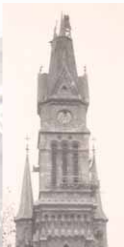
Torre do sopro, 1956

do casal real Mihály Munkácsy e também Ferenc Liszt . É construído nos anos seguintes, de acordo com os planos de Győző Czigler o complexo de edifícios Praça Bakáts neo-renascimento, dentro da paróquia e em 1884 entre o município e a escola.