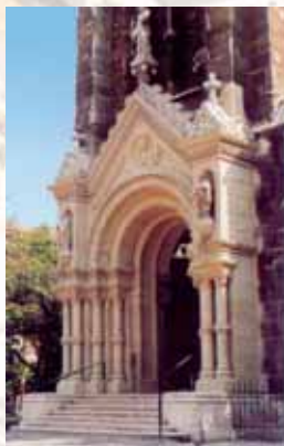
O portão principal foi renovado em 2002

Em 1838 foram causados danos por pragas que vieram por inundações de enchentes, com isso em 1865 fecharam a igreja. Frigyes Feszl, e Imre Steindl Miklós Ybl e assim foram escolhidos os projetos neo-românico. Foi construído com o apoio financeiro do Estado e da igreja e foi consagrada no dia 24 de abril de 1879 arcebispo Simor János – Podemos ver o brasão de armas dele que foi construído no altar principal. Quando os artistas ilustres deram os eminentes de sua intenção de admirar as obras de mestres foi durante as bodas de prata