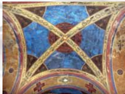
A cripta com a pintura do teto é a única parte original que permaneceu

A igreja como é vista agora passou por várias pequenas reformas, por ter sofrido durante muito tempo uma considerável deterioração. Uma das consequências foi essa marquise em frente ao portão principal ou os sinos no sul. Nossa Comunidade da esperança que algum dia foi imaginado pelos antigos e hoje realmente podemos ver na Igreja principal do Bairro Francisco .