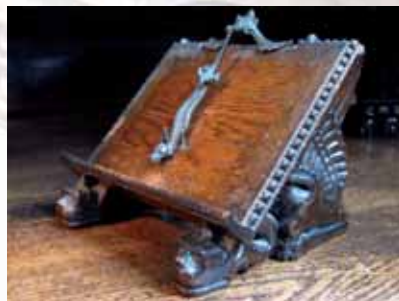
Pequeno porta-livro na Sacristia

“NA CAPITAL, PELO MENOS ATÉ ESSA ÉPOCA, NÃO SE VIA IGREJA CATÓLICA, proporcionalidade da popularidade e uniformidade feita por pessoas.” – assim escreveu Vilmos Kurtz, o nosso primeiro pároco. A nossa Igreja com estilo neo-românico, pré-estudo com a Basilica de Sto Estevão . Essa Igreja contém elementos basilical por imagem total de Puritan saindo do Santuário monumentos basilicais foram todos imagem saindo do mundo rico dos santuários.