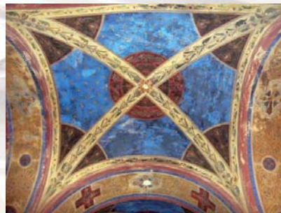
Az egyedül az alttemplomban megmaradt eredeti mennyezeti festés

A templom mára a kisebb felújítások ellenére jelentős állagromlással ment át – ennek folyománya a főkapu előtti védőtető, vagy a harangok déliei némasága. Közösségünk imái mellett gazdag liturgikus és kulturális életével hívja fel a figyelmet a benne rejlő értékekre, annak reményével, hogy egyszer majd a régiek által megálmodott valójában láthatjuk Ferencváros főtemplomát .