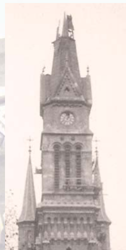
Szétlőtt torony, 1956

A századfordulón az esztergomi főegyházmegye papsága vette át a templomi szolgálatot. A világégések során károsodott templomot a közösség ugyan még saját erejéből állította helyre, a Rákosi-diktatúra azonban elfojtotta a plébánia jelentős civil és karitatív tevékenységét; a Ráday u. 57-ben működő kultúrházunkat államosították. '56-ban a tér komoly harcok (és kivégzések) szomorú színhelye volt. A rendszerváltás után megújult közösségi életünk , melynek ékes nyoma a felújított plébániaépület: Ferencváros katolikus hívei immár közel két évszázada találhatnak lelki otthonra.