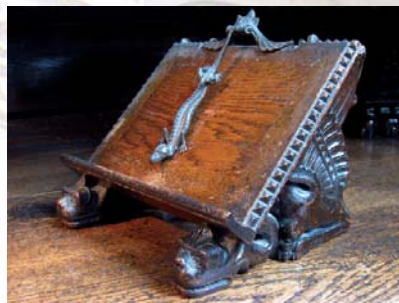
Kis könyvtartó a sekrestyében

„A FŐVÁROSBAN EDDIG AMÚGY SEM LÉVÉN katólikus templom, mely arányossága, stílszerűsége és egyöntetűsége által hatna az emberre” – így ír Kurtz Vilmos, első plébánosunk. Neoromán stílusú templomunk rokona az Ybl-életműben a főtínak, előtanulmánya a Szent István Bazilikának . A monumentális, bazilikális elemek (pl. a mellékhajók vakárkádsora) adta puritán összképből kilóg a szentély gazdag formavilága.