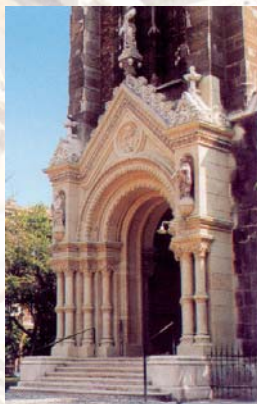
A 2002-ben felújított főkapu

Az 1838-as pesti árvíz okozta károk miatt 1865-re a templomot bezárták. Az Erzsébet királyné védnökségét elnyerő templomépítő bizottság a tervezői pályázaton Feszli Frigyes, valamint Steindl Imre neogót elképzelése helyett Ybl Miklós neoromán terveit választotta. Az állam és a főváros anyagi támogatásával felépült templomot 1879. április 24-én szentelte fel Assisi Szent Ferenc tiszteletére Simor János hercegprímás – címerét az általa építtetett főoltáron láthatjuk. A kor jeles művészei, mesterei által végigvitt munkálatok csodájára járt az ezüstlakodalmas királyi pár mellett Munkácsy Mihály és Liszt Ferenc is. A rákövetkező években épült fel Czigler Győző tervei szerint a Bakáts tér neoreneszánsz épületegyüttese, benne az önkormányzat és az iskola között 1884-re a plébániával.